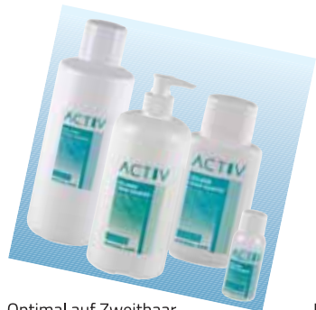
Optimal auf Zweithaar abgestimmte Pflegeprodukte.

“Es gibt keinen Grund, sich zu verstecken.“